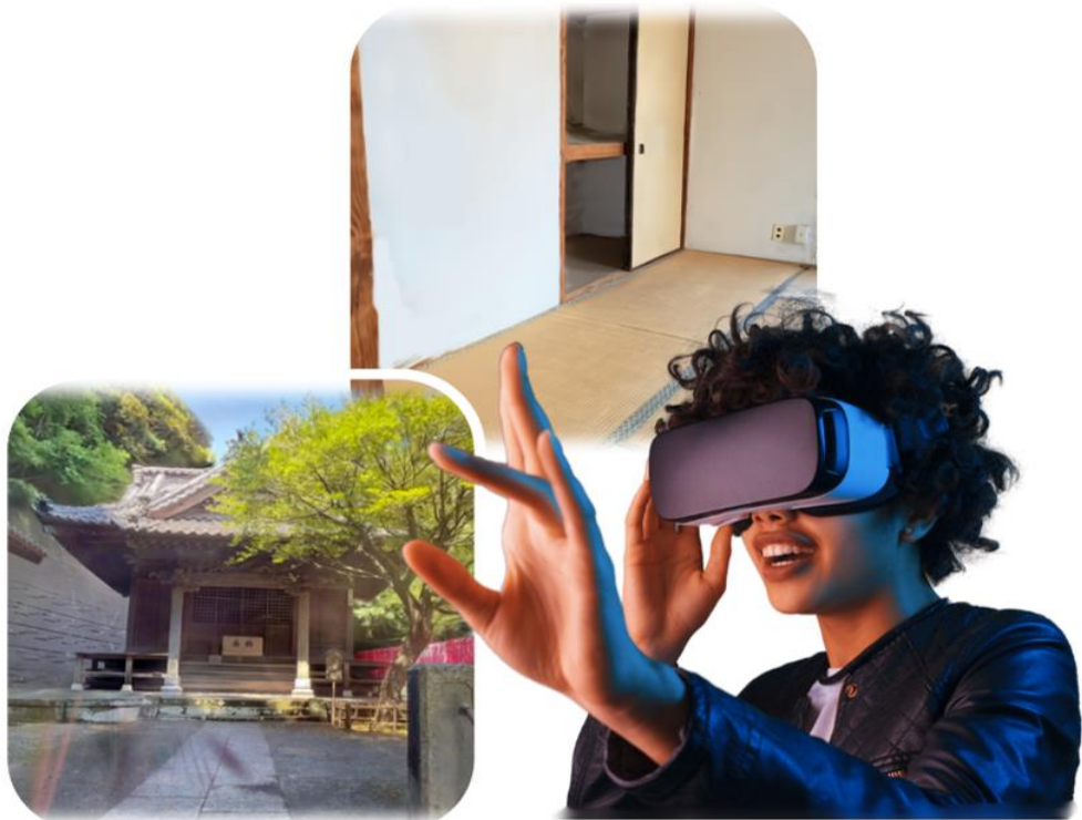
(plyファイルから生成されたメタバース空間の例)

現在、世界中のクリエイター・技術者たちが【Gaussian Splatting】による3D生成に取り組んでいますが、作成したものを共有するプラットフォームがありません。3Dで生成された建物の中を自由に歩いたり、見たい部分だけを詳しく見るなどの、その特徴や魅力を広く一般向けに提供する場が必要とされています。そこで今回、plyファイルを【どこでもドア】にアップロードするだけでメタバース空間が生成される機能が実現しました。